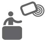
Installation d'un guichet adapté aux personnes à mobilité réduite